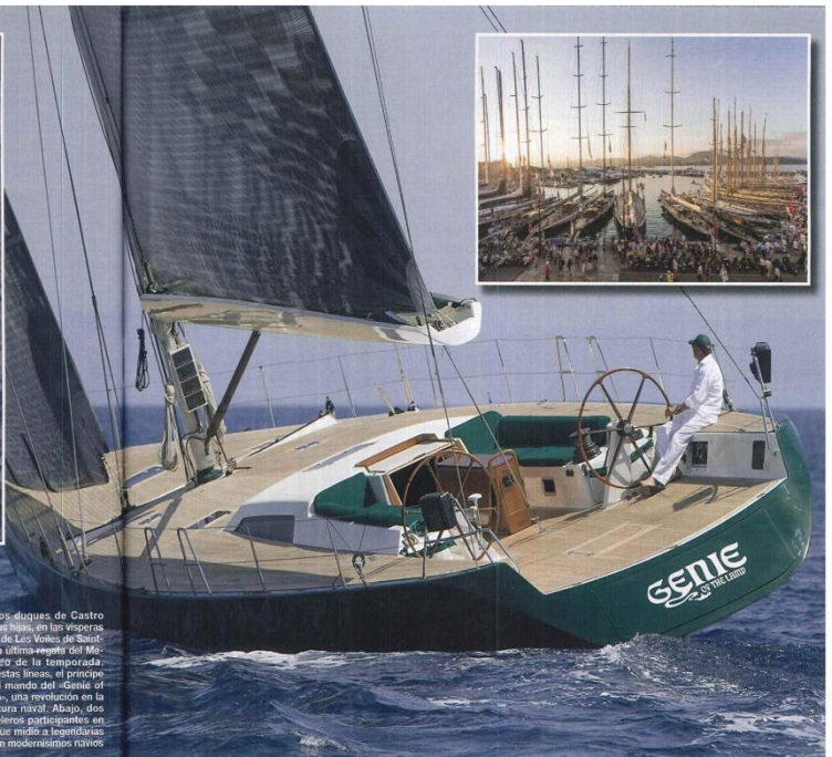
Arriba, los duques de Castro junto a sus hijas, en las visperas del inicio de Les Voiles de Saint-Tropez, la última regata del Mediterráneo de la temporada. Junto a estos chicos, el príncipe Carlos al mando del «Genie of the Lamp», una revolución en la arquitectura náutica. Abajo, dos de los veleros participantes en el rally, que reúne a legendarios navegantes con modernísimos veleros

Arbitros de una impresionante cita en Saint-Tropez, donde promovieron su causa más querida: la lucha contra el hambre