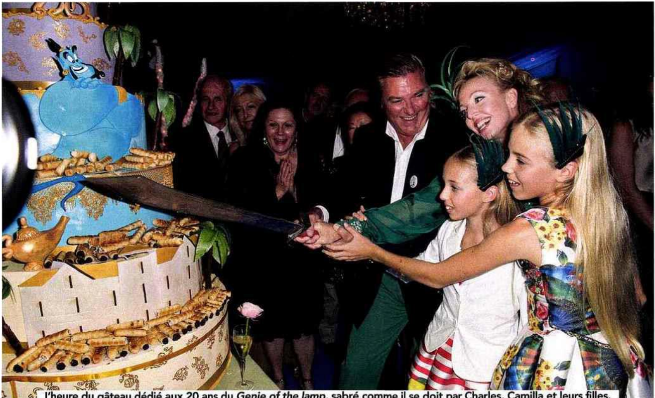
L'heure du gâteau dédié aux 20 ans du Genie of the lamp, sabré comme il se doit par Charles, Camilla et leurs filles.