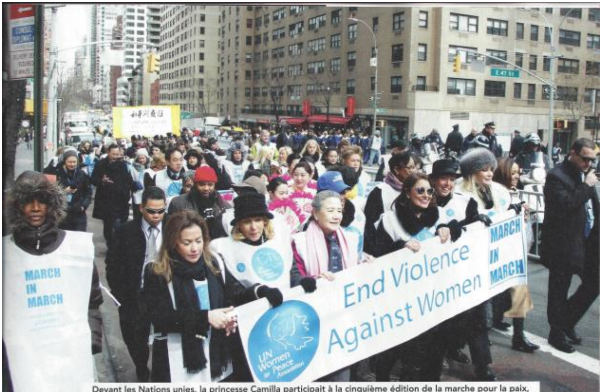
Devant les Nations unies, la princesse Camilla participait à la cinquième édition de la marche pour la paix, March in March , en compagnie de mesdames Ban Soon-taek et Muna Rihani Al-Nasser.