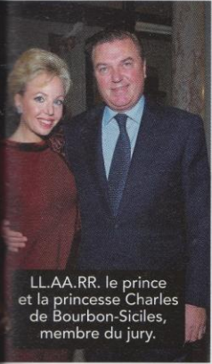
LL.AA.RR. le prince et la princesse Charles de Bourbon-Siciles, membre du jury.