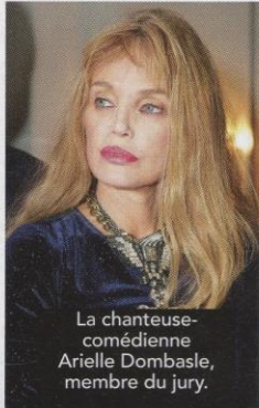
La chanteuse-comédienne Arielle Dombasle, membre du jury.