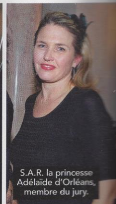
S.A.R. la princesse Adélaïde d'Orléans, membre du jury.