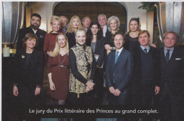
Le jury du Prix littéraire des Princes au grand complet.