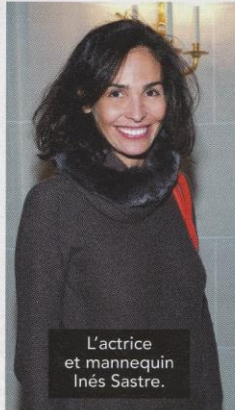
L'actrice et mannequin Inés Sastre.