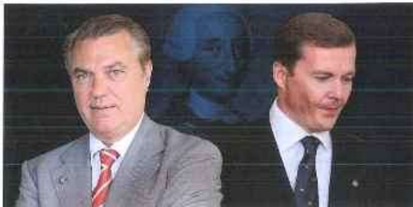
El duque de Castro y el duque de Calabria, en un fotomontaje realizado por Vanitatis.

Arrancan los actos del 300 cumpleaños del rey. En el trasfondo, la pugna entre el duque de Castro y el de Calabria por la jefatura de la Casa Real Borbón-Dos Sicilias