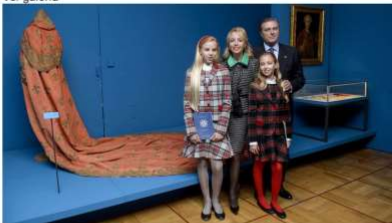
La visita de los duques de Castro y sus hijas a Madrid